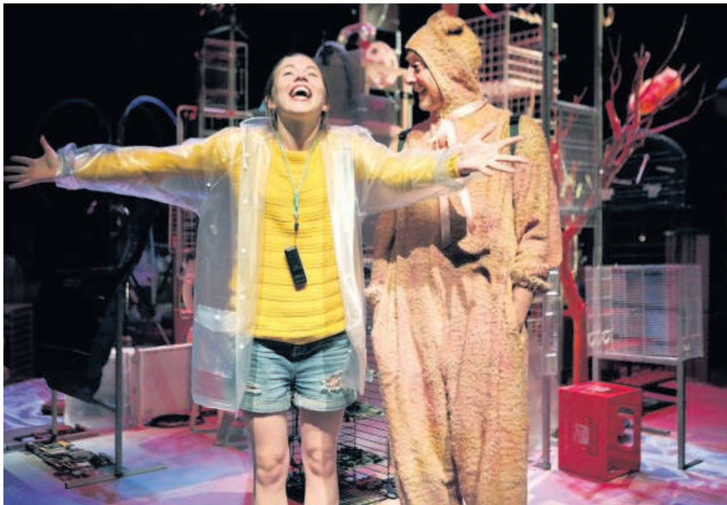
'Lief en leed in het leven van de giraf' is een Alice in Wonderland-achtig verhaal, 'maar dan ruiger en actueler'.

Voor welk publiek werkt hij liever, voor kinderen of volwassenen? "Dat is een onmogelijke